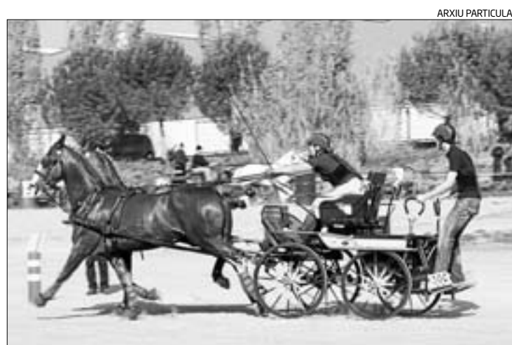
Dos dels participants en categoria Tronc (amb dos cavalls)